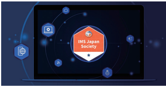
IMS Japan Home Page

デジタルバッジは学習活動の成果を「画像」と「標準化されたデジタルデータ」によって示します。獲得したバッジは世界中でその学習者だけの、ただ一つのもので、異なるプラットフォームの間で共有できる、直感的で分かりやすく信頼性の高いコミュニケーション・ツールとして、デジタルバッジは様々な分野におけるスキルの提示や人材の獲得に用いられています。