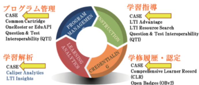
さまざまな教育活動での利用が期待されるCASE ® 技術標準

カリキュラムやシラバスに記載される情報、カリキュラム標準やコンピテンシーモデルの構成など、学習目標と評価基準（ルーブリック）を記述するときに使う、IMS技術標準です。比較的新しい標準で、最新版CASE 1.0は2017年に公開されています。PDFやHTML文書をこえて、シンタックスとセマンティクスの両面で機械可読性を高めるための技術標準であり、機械による自動処理を想定しています。